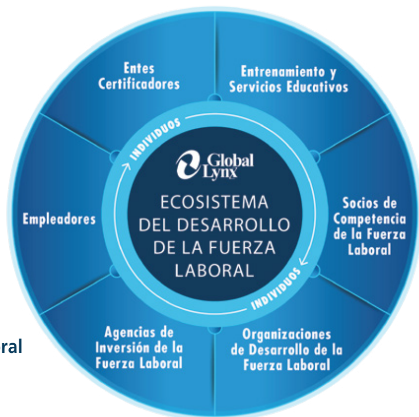
Ecosistema de Desarrollo de la Fuerza Laboral

Son las organizaciones que proveerán el capital para capacitar a los individuos.